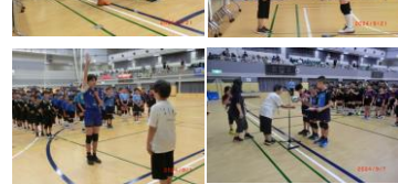
8月17日「サマーフェスティバル」