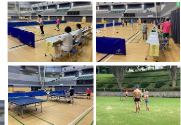
8月28日、1月26日練馬区ポッチャ交流大会 @練馬区×オーニス連携